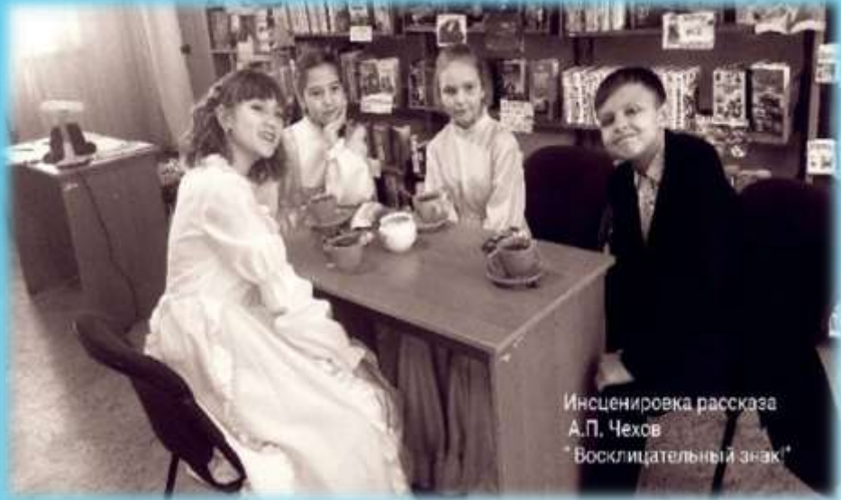
Инсценировка рассказа А.П. Чехов "Восклицательный знак!"