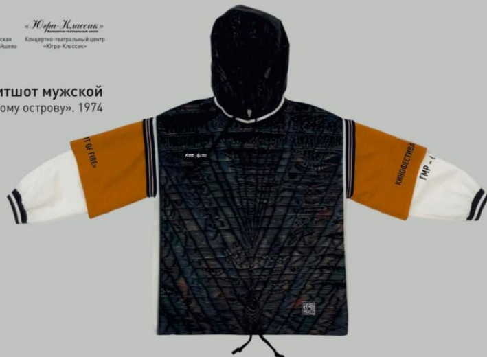
Свитшот мужской «Поездка к священному острову». 1974

«Югра-Классик» Концертно-театральный центр «Югра-Классик»