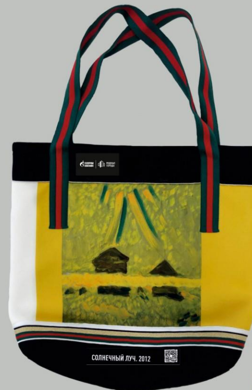
Сумка-шоппер мужская Солнечный луч. 2012 A Sun Ray. 2012

«Югра-Классик» Концертно-театральный центр «Югра-Классик»