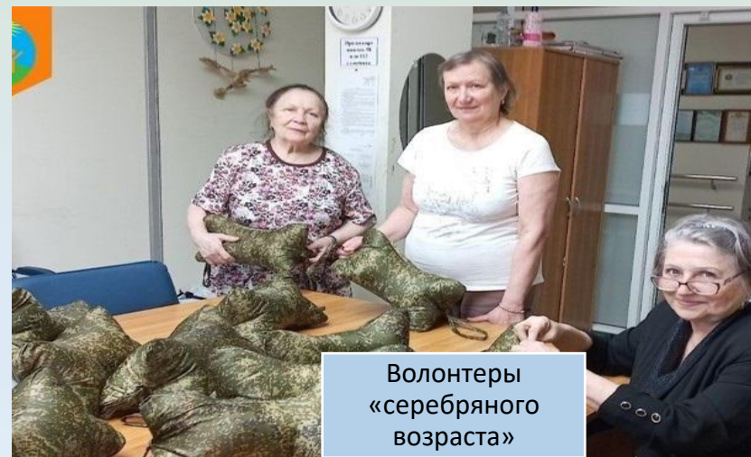
Волонтеры «серебряного возраста»