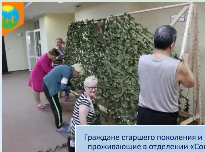
Граждане старшего поколения и инвалиды, проживающие в отделении «Социальные квартиры для одиноких престарелых»

В реализации проекта участвуют граждане пожилого возраста от 55 лет и старше, люди с ограниченными возможностями здоровья 50 лет и старше, посещающие полустационарное отделение социальной реабилитации и абилитации, граждане, проживающие в социальных квартирах для одиноких престарелых, корпоративные, «серебряные» волонтеры.