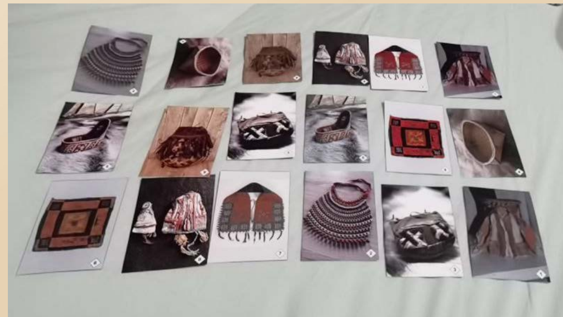
Пример разработанной игры по традиционным предметам народа манси Сосьва-Ляпинского территории по принципу известной игры МЕМО

Учреждения образования и культуры Березовского района - площадки реализации проекта