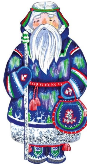
Елочная игрушка «Ищки Ики»

Ищки Ики в переводе с хантыйского языка морозный мужчина. Он приносит в дом счастье и достаток. Ищки Ики приходит во второе полугодие, которое начинается с октября - это пора «большой осени» или «малой зимы». Ищки Ики охотник, умный, справедливый, присматривает за зверьями и порядком в лесу. Помогает заблудившимся выбраться из лесу, смотрит чтобы для всех корма в лесу хватало. Он приносит с собой мороз. А где появляется, там северное сияние мы видим. Серьезный и добрый. Его время года это осень и зима.