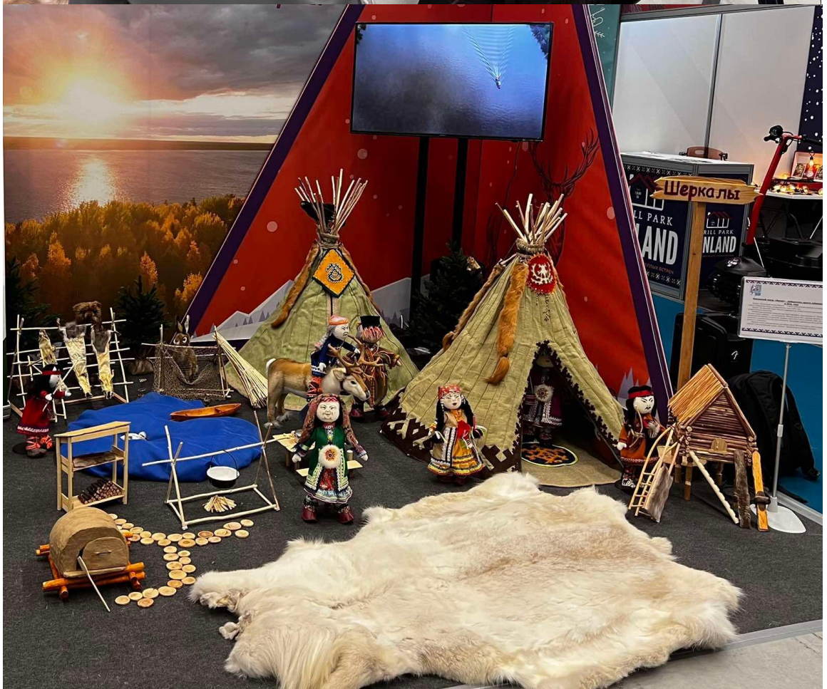
Село Шеркалы, 31.01.2024 год. Дорогие друзья, мы горды рассказать вам о том, что сегодня нам выпала большая честь представлять Октябрьский район на Международной выставке-форуме "Россия" в Москве. С культурой, обычаями, традициями древней