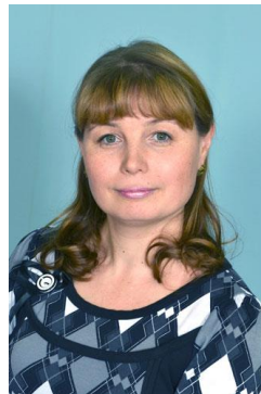
Работа с детьми, взаимодействие с родителями