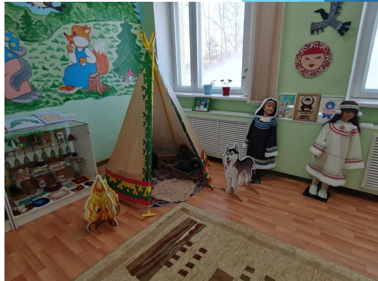
Музейная экспозиция «Стойбище»