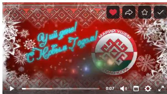
Новогоднее поздравление мари Сургута. РОО ХМАО-Югры "Марий ушем" ("Союз мари")

#Сургут #Югра #марицыпоймут #МарийцыЮгры #МарийцыРоссии #мариулам