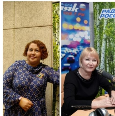
13 07 2020 "Поро эр, Марий Эл" [слушать] www.gtrkmariel.ru

«...изолируемся, но не перестаем работать!»