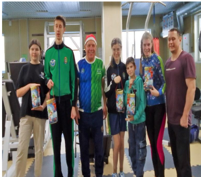
Новогодние подарки спортсменам от «ДЖИН»