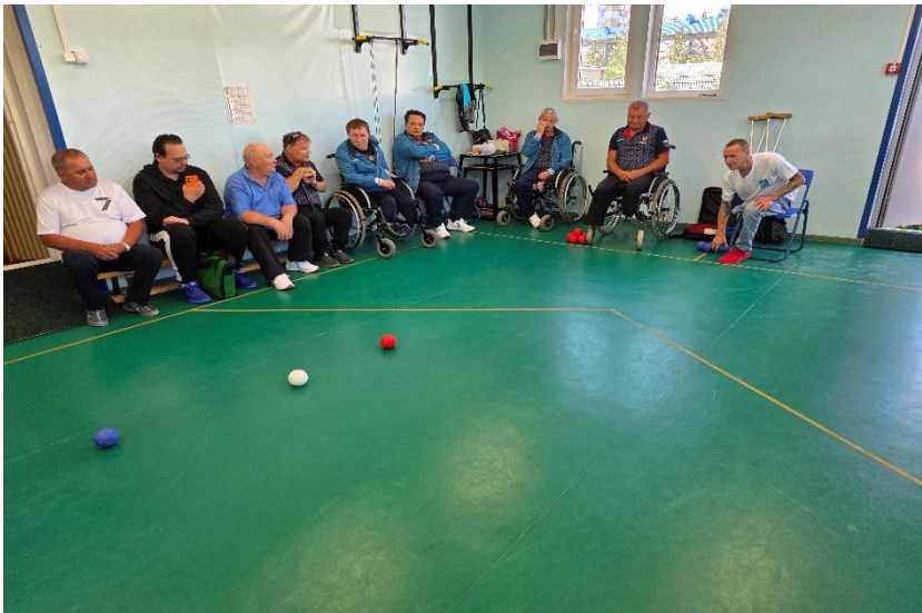
Соревнования по бочча