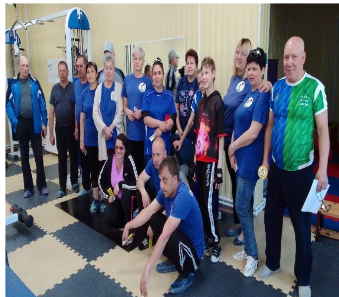
Перед началом тренировки