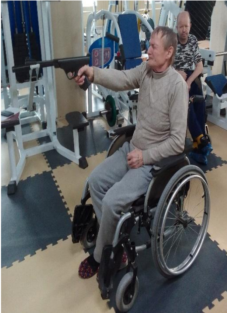
Соревнования по стрельбе