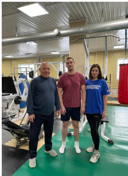
Участник СВО «Бизон» с представителем Фонда «Защитники отечества»