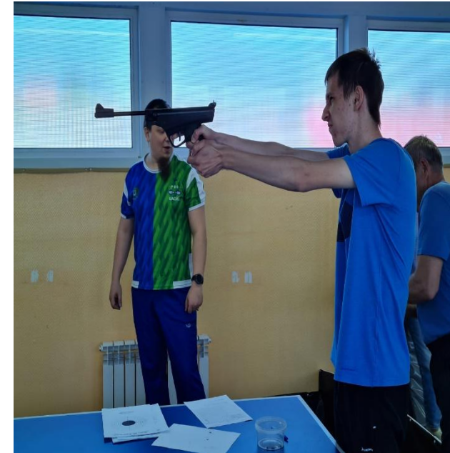
стрельба стоя – тренировка