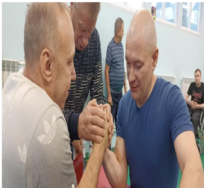
Соревнования по армреслингу