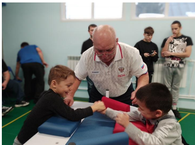
Соревнования по армспорту