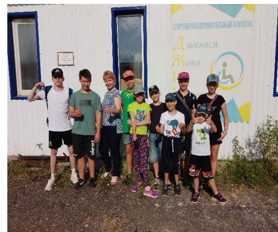
Дети с ОВЗ после тренировки в СК «ДЖИН»