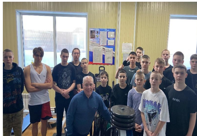
Открытие памятного уголка Герою России Бузину А.С.