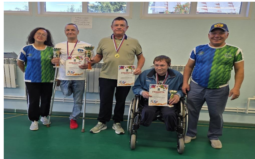
Победители и судьи