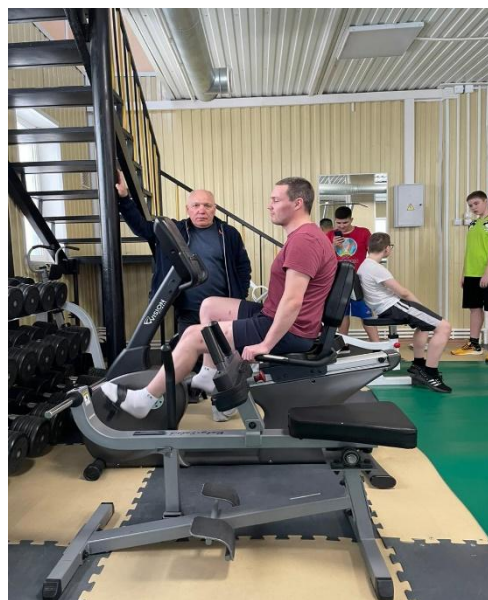
Реабилитация ног после ранения позывной «Бизон»