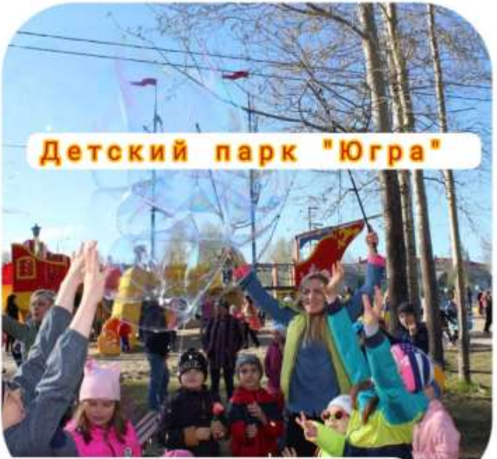
Детский парк "Югра"

Опыт работы с детьми с ОВЗ, и на массовых мероприятиях!