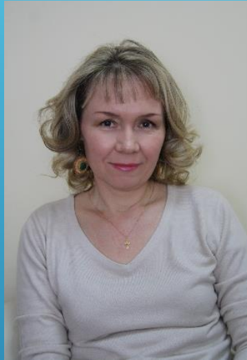
Трифонова Зоя Алексеевна автор