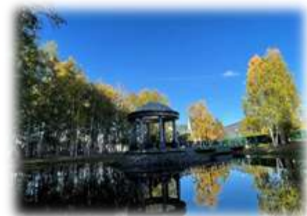
5. Парк Лосева