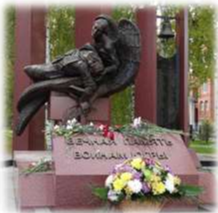
6. Памятник югорчанам павшим в локальных войнах