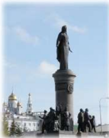
8. Памятник «Бронзовый символ Югры».