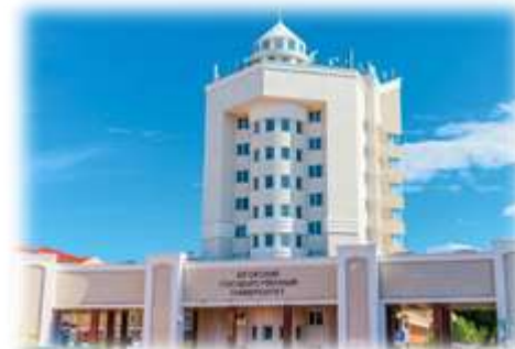
9. Югорский государственный университет