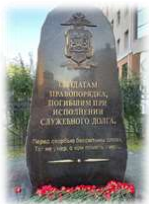
2. Обелиск Солдатам Правопорядка, погибшим при исполнении служебного долга