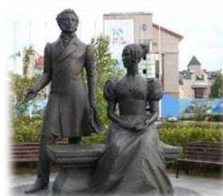
4. Памятник А.С. Пушкину и его супруге Наталье Гончаровой.