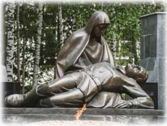
7. Парк Победы.