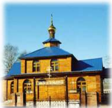
1. Храм в честь иконы божией матери «Знамение»