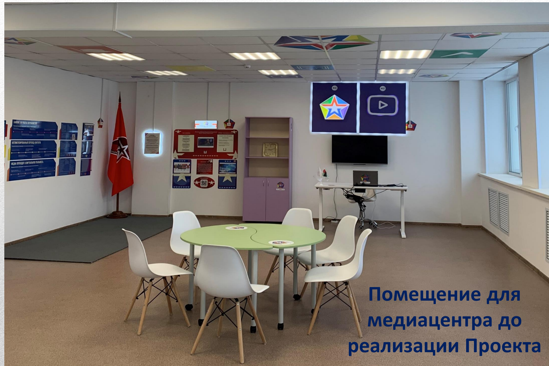
Помещение для медиацентра до реализации Проекта