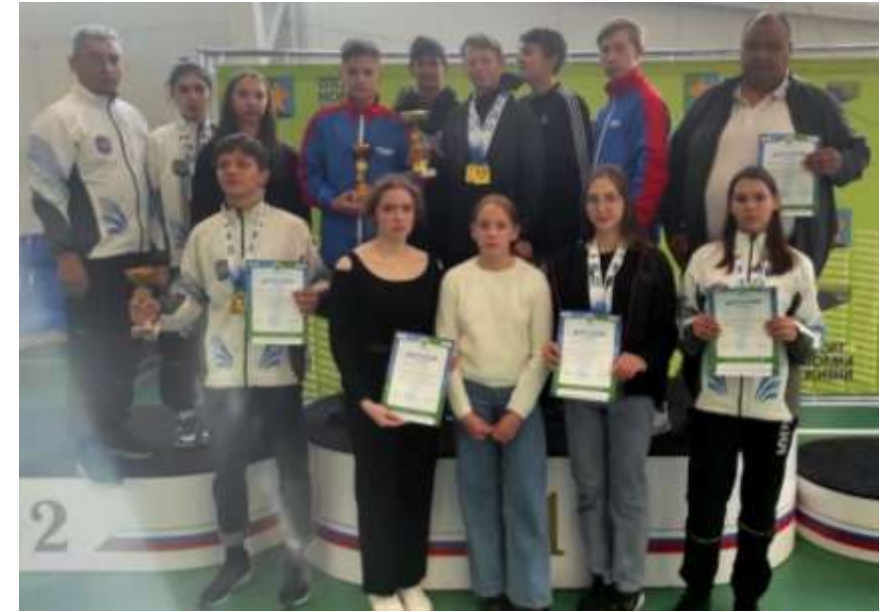
Сборная Ханты-Мансийского района на окружных соревнованиях по национальным видам спорта

В рамках проекта будут проведены соревнования по национальным видам спорта “Северное многоборье” в д. Согом. Соревнования будут торжественно открыты проведением хантыйского обряда, на протяжении соревнований будет организована работа выставки-ярмарки с изделиями декоративно-прикладного искусства народов ханты, проведены мастер-классы по изготовлению хантыйских кукол-оберегов и других национальных изделий. Для участия в соревнованиях будут сформированы 6 команд из числа жителей Ханты-Мансийского района, состав каждой команды - 16 человек.