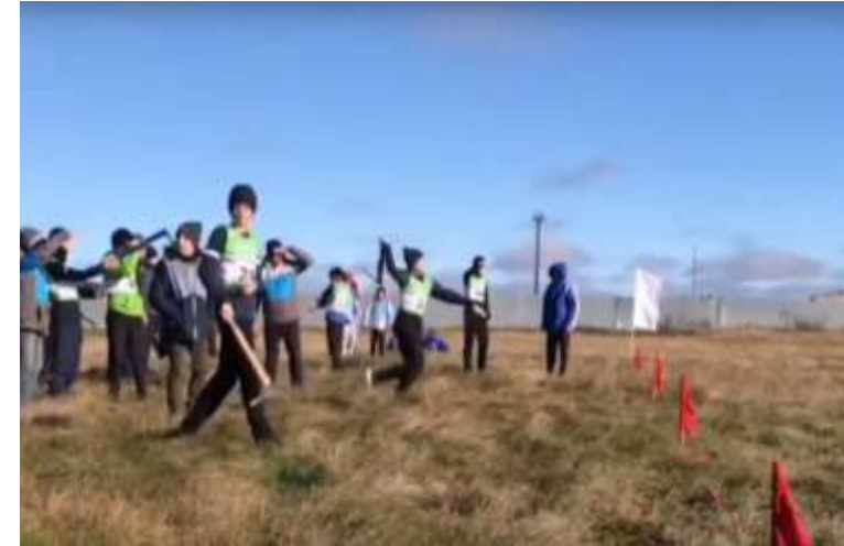
Метание топора на дальность