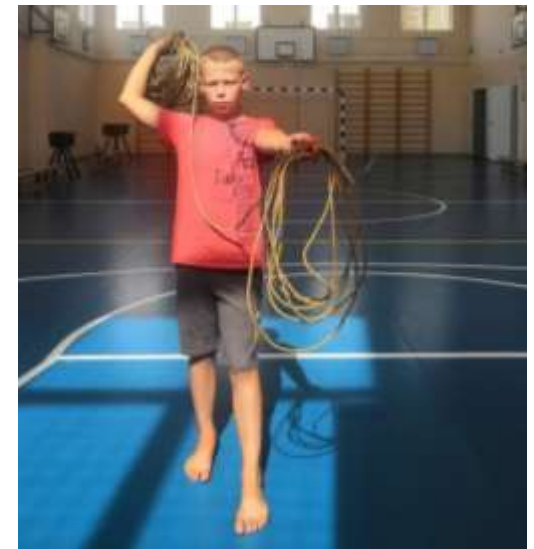
Метание тынзяна на хорей