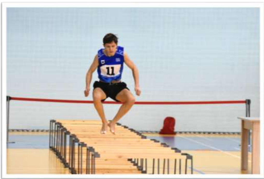
Прыжки через нарты