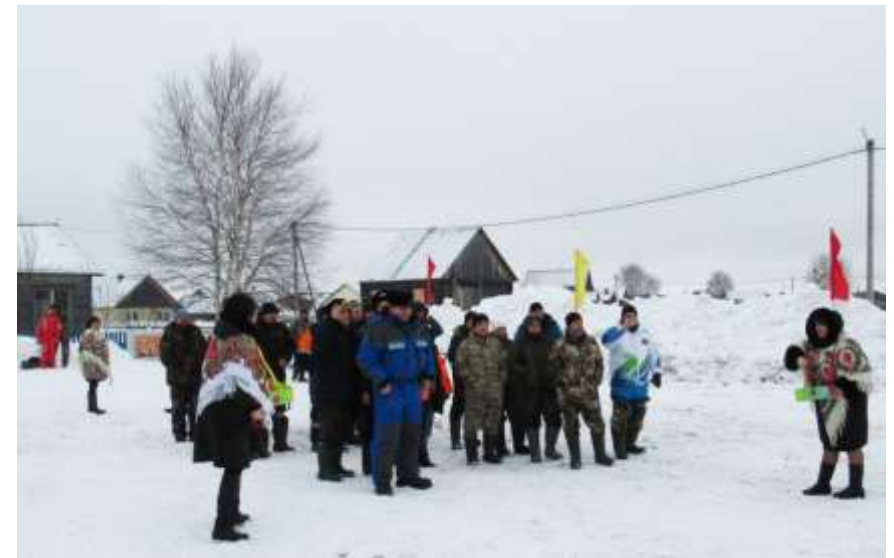
Проведение хантыйского обряда в д. Согом