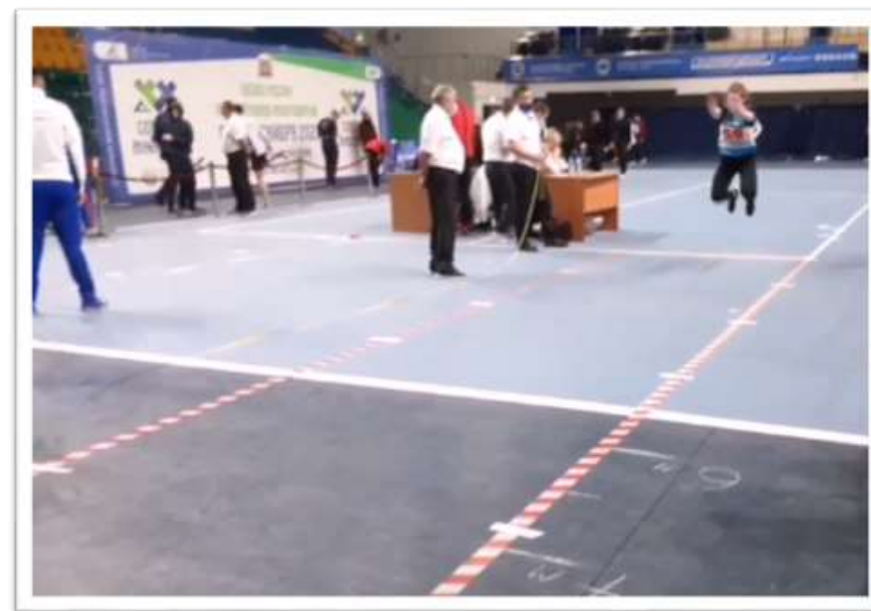
Тройной национальный прыжок с отталкиванием двумя ногами