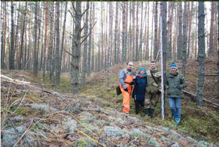
Городки близ села Болчары (фрагменты)