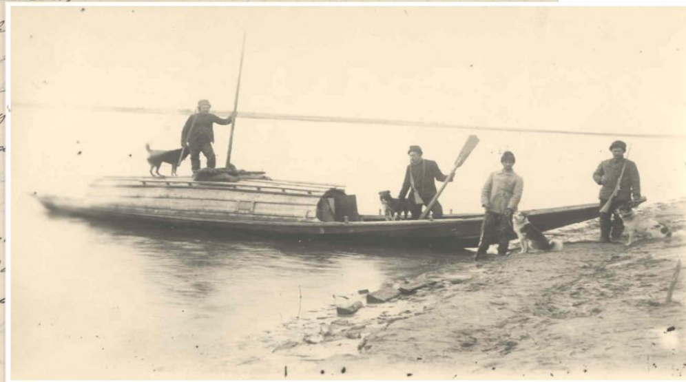
Отправка экспедиции 1908 г. из с. Самарово.