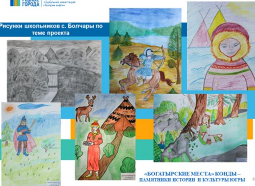
«БОГАТЫРСКИЕ МЕСТА» КОНДЫ – ПАМЯТНИКИ ИСТОРИИ И КУЛЬТУРЫ ЮГРЫ